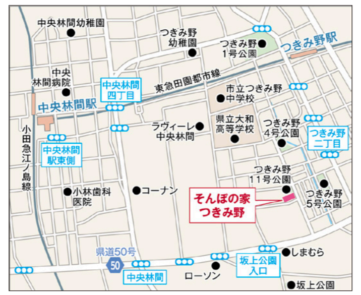
〒242-0002 神奈川県大和市つきみ野1-5-3

東急田園都市線「つきみ野」駅から、徒歩約11分。 改札口より前方道路を左方向へ→約400m先「つきみ野2」交差点を右折→約200m先の十字路を左方向へ→約150m先の十字路を右折→その右側角にある3階建の建物がホームです。