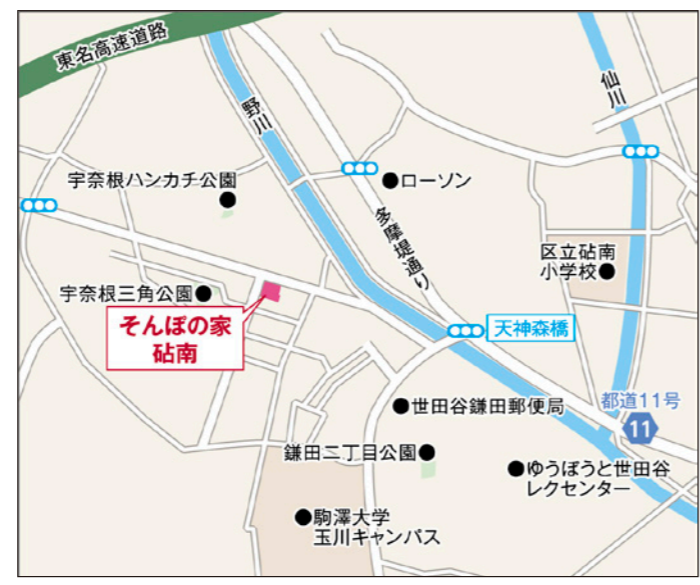
〒157-0068 東京都世田谷区宇奈根1-41-12