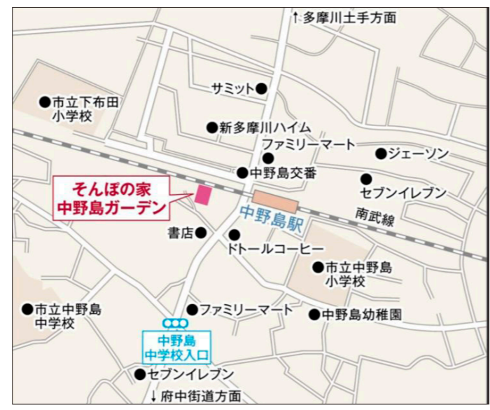
〒214-0012 神奈川県川崎市多摩区中野島1-1-11

JR南武線「中野島」駅から、改札口出て左へ進み、 1つ目の路地を右へ(角にコーヒーショップ) 50m 右手側にホーム(徒歩約2分)。