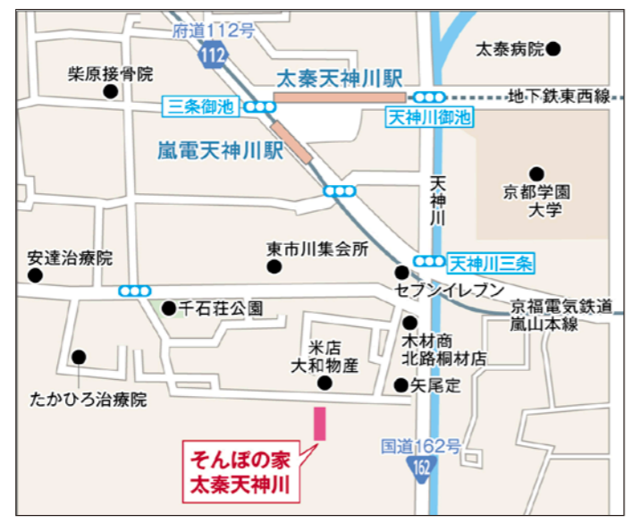
〒616-8112 京都府京都市右京区太秦木ノ下町16-9

京福電鉄嵐山本線「嵐電天神川」駅から、徒歩約7分。京都市営地下鉄東西線「太秦天神川」駅から、徒歩約8分。三条通りを東に進み三条天神川交差点を右折、京福電鉄の踏切を渡りすぐを右折、すぐ左側の小道(電信棒あり)を左折そのまま道なりに直進し突き当りを右折し50m直進すれば左側に当施設(5階建茶色の外壁)が見えます。向いに米屋さんがございます。