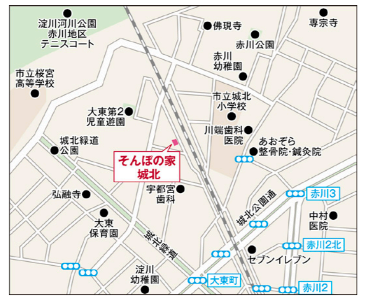
〒534-0002 大阪府大阪市都島区大東町3-5-19

【「そんぼの家」共通施設概要】 ●居室設備:洗面、暖房便座、緊急呼出装置、収納、下駄箱、浴室、ミニキッチン、洗濯機スペース、固定電話設置可能、玄関収納椅子 ●共用施設・設備:ダイニング(食堂)兼 機能訓練コーナー、浴室(個別・特殊浴)、洗濯室、トイレ、浴室・トイレにナースコール、他 ●入居対象:原則65歳以上の方で、介護保険受給認定を受けている方 ●類型:介護付有料老人ホーム(一般型特定施設入居者生活介護) ●土地の建物の所有形態:事業主体非所有 ●居住の権利形態:利用権方式 ●利用料の支払い方法:月払い方式 ●介護保険:特定施設入居者生活介護・介護予防特定施設入居者生活介護 ●介護居室区分:全室個室 ●介護にかかわる職員体制:要介護者の合計人数:配置直接処遇スタッフの人数=3.0:1以上 ※週40時間の常勤換算