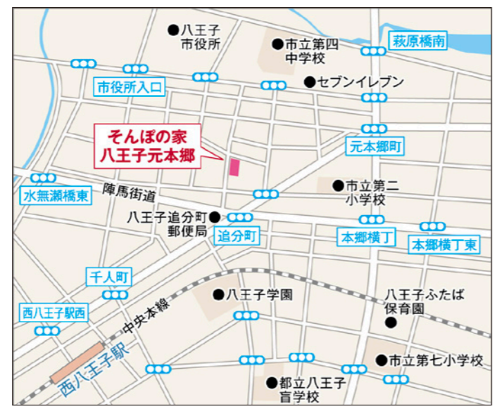
〒192-0051 東京都八王子市元本郷町2-1-12

JR中央線「西八王子」駅北口より徒歩の場合、「追分町」交差点方面へ徒歩約10分。