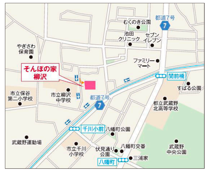
〒202-0022 東京都西東京市柳沢3-5-27

「伏見通り」を三鷹方面よりお越しの場合、「関前橋」交差点を超えてすぐの「新柳沢団地東」の交差点を左折。少し直進し「タイムズカーUR」がある交差点を左折。「柳沢団地9号棟」で左折し道なり。カーナビ設定の際は「西東京市立柳沢中学校」をご設定すると便利です。