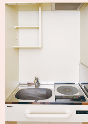
火を使わない安全なIHコンロを装備