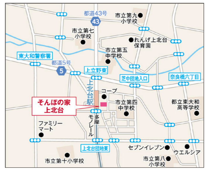
〒207-0021 東京都東大和市立野2-3-11

多摩モノレール「上北台」駅より改札を出て右手の階段を降り、スーパー「コープ」沿いに直進→「コープ」に沿って右折していただき、隣接している建物がホームです。