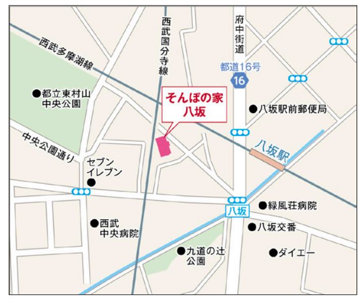
〒189-0013 東京都東村山市栄町3-23-1

西武多摩湖線「八坂」駅から、府中街道を左に曲がり30m直進。「八坂」交差点(九道の辻)を大きく右に曲がり、府中街道と江戸街道の間の道に入り、180mほど直進した左手に建物がございます。