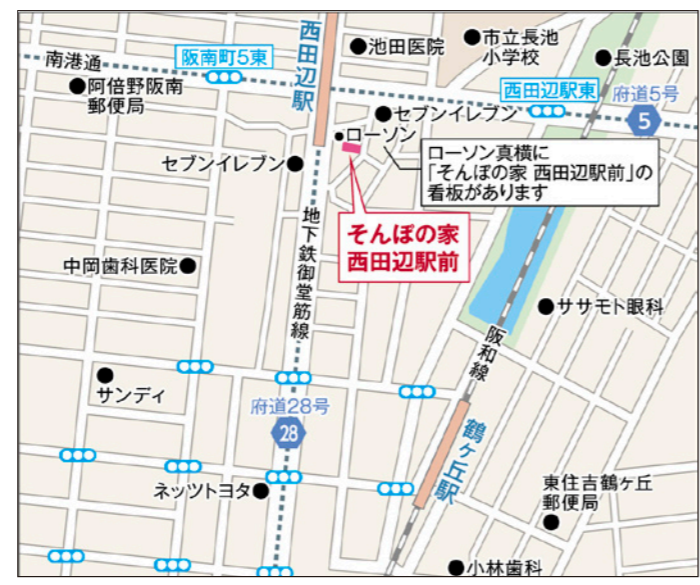
〒545-0014 大阪府大阪市阿倍野区西田辺町1-1-21

Osaka Metro「西田辺」駅 2番出口から徒歩約2分。 ※2番出口を出てすぐの「ローソン」近くに、ホームの看板を設置しています。