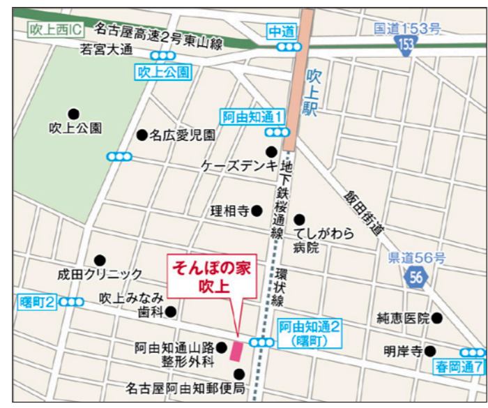
〒466-0027 愛知県名古屋市昭和区阿由知通2-6

【「そんぼの家」共通施設概要】 ●居室設備:洗面、水洗トイレ、ナースコール、収納、浴室、ミニキッチン、洗濯機スペース、固定電話設置可能 ●共用施設・設備:ダイニング(食堂)兼 機能訓練コーナー、浴室(個別・特殊浴)、洗濯室、トイレ、浴室・トイレにナースコール、他 ●入居対象:原則65歳以上の方で、介護保険受給認定を受けている方 ●類型:介護付有料老人ホーム(一般型特定施設入居者生活介護) ●土地の建物の所有形態:事業主体非所有 ●居住の権利形態:利用権方式 ●利用料の支払い方法:月払い方式 ●介護保険:特定施設入居者生活介護・介護予防特定施設入居者生活介護 ●介護居室区分:全個室 ●介護にかかわる職員体制:要介護者の合計人数:配置直接処遇スタッフの人数=3.0:1以上 ※週40時間の常勤換算