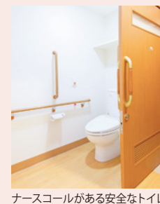
ナースコールがある安全なトイレ