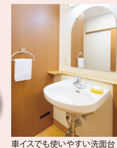
車イスでも使いやすい洗面台