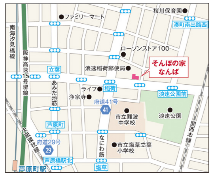
〒556-0023 大阪府大阪市浪速区稲荷1-12-7