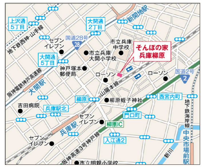
〒652-0815 兵庫県神戸市兵庫区三川口町3-5-15

【「そんぼの家」共通施設概要】 ●居室設備:洗面、水洗トイレ、ナースコール、収納、下駄箱、他 ●共用施設・設備:ダイニング(食堂)兼 機能訓練コーナー、浴室(個別・特殊浴)、トイレ、他 ●入居対象:原則65歳以上の方で、介護保険受給認定を受けている方 ●類型:介護付有料老人ホーム(一般型特定施設入居者生活介護) ●土地の建物の所有形態:事業主体非所有 ●居住の権利形態:利用権方式 ●利用料の支払い方法:月払い方式 ●介護保険:特定施設入居者生活介護・介護予防特定施設入居者生活介護 ●介護居室区分:全室個室 ●介護にかかわる職員体制:要介護者の合計人数:配置直接処遇スタッフの人数=3.0:1以上 ※週40時間の常勤換算