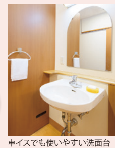
車イスでも使いやすい洗面台