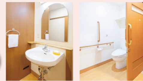
車イスでも使いやすい洗面台 ナースコールがある安全なトイレ