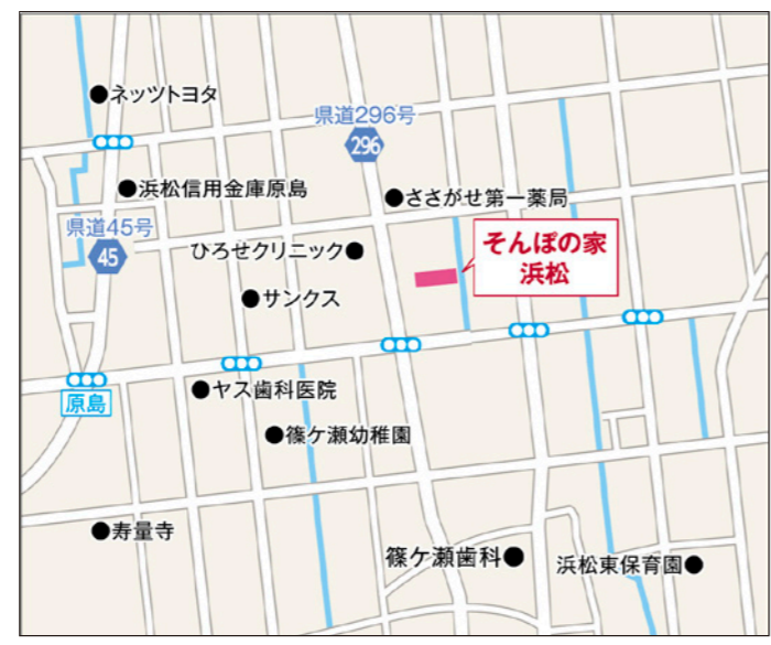
〒435-0042 静岡県浜松市中央区篠ヶ瀬町412

JR「浜松」駅から、バス「78番線 浜松～産業展示館」方面で「篠ヶ瀬北」下車。西へ73m程直進し一番目の交差点を横断歩道を渡る前に右折する。80m程直進すると通り沿い。