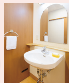
車イスでも使いやすい洗面台