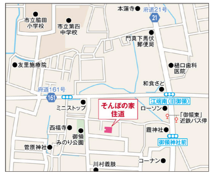
〒574-0064 大阪府大東市大東市御領1-7-22