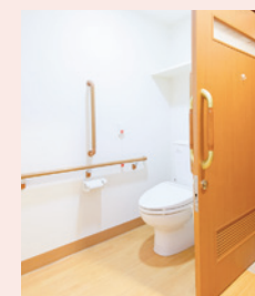
ナースコールがある安全なトイレ