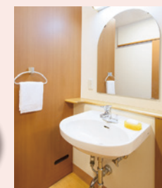
車イスでも使いやすい洗面台