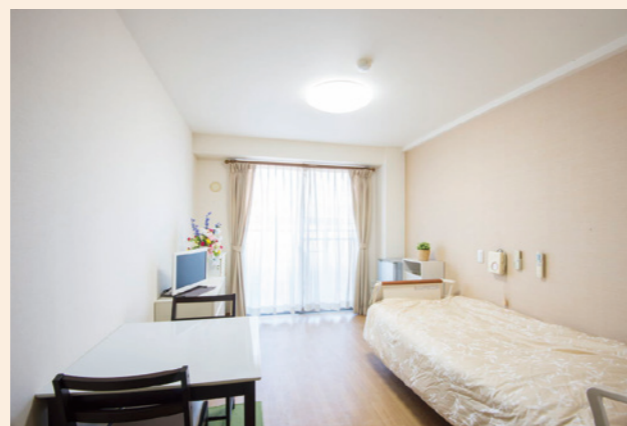
自分らしくのびのびと過ごせる居室