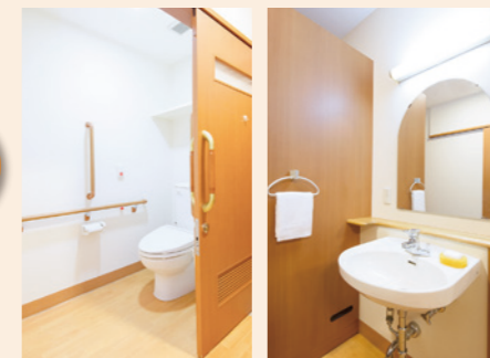
車椅子でも使いやすいトイレと洗面台

※居室内の設備や間取りは、ホームや各居室によって異なる場合があります。詳しくは、介護なんでも相談室までお問合せください。