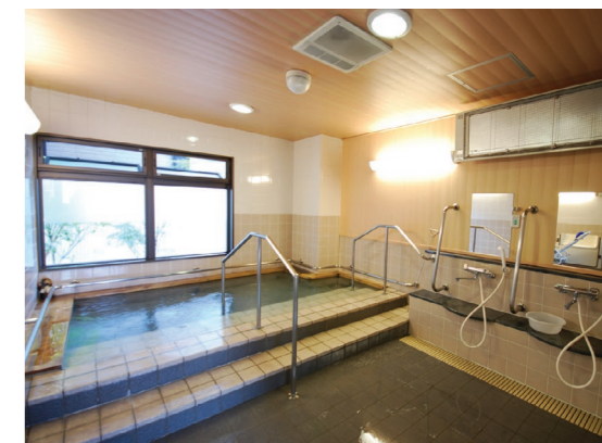
ゆったりとした気分で入れる大浴場