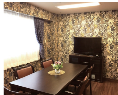
明るく華やかな雰囲気の良い相談室