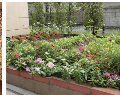
四季折々の風情が楽しめる庭