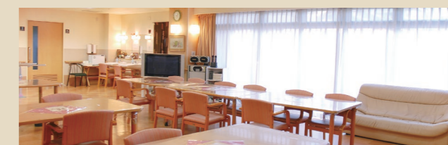
SOMPOケア ハッピーデイズ岸和田 テイルーム

介護が必要な方は、1Fに併設しているデイサービスや訪問介護をご利用いただき、介護サービスを受けることができます(ご希望により、他の訪問介護サービス事業所等との契約も可能です)。また、併設している訪問看護は緊急時訪問看護加算が利用できますので緊急事態にも対応可能です。ホーム近くのクリニックの訪問診療を受けることもできます。