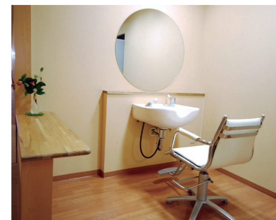
いつまでも美しくいていただくための理美容コーナー

自由度の高い暮らしで長く住み続けていただきたい。 心強い介護サービスの連携で安心・安全を。