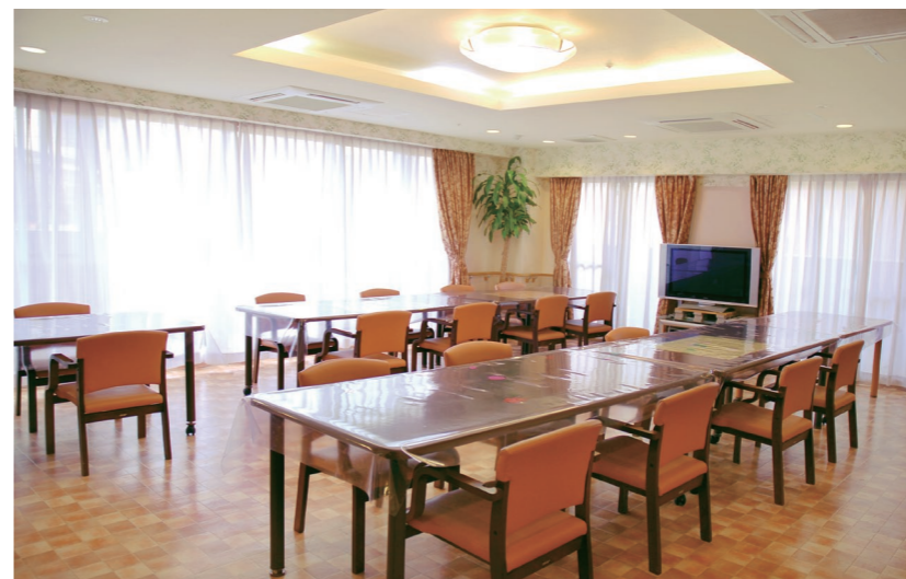
大きな窓から陽光が差し込む、明るさいっぱいのダイニング

ゆったりとしたダイニング(食堂)や四季の移ろいを感じられる庭など、日常的にゆとりと癒しを実感できる共用空間・設備をご用意しています。