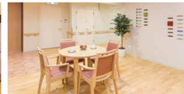
日々のリハビリやご入居者さまどうしの会話も弾む多目的スペース