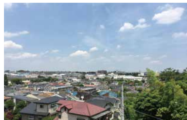
3階東側からの眺望

自分らしくいきいきと、毎日の暮らしそのものがリハビリにもなるホーム。それが、「SOMPOケア ラヴィーレ 綾瀬」です。ホームの東側がゆるやかな丘陵になっているため、見晴らしの良い景色が広がります。近くには散歩を楽しめる「小園子之社(こぞのねのしゃ)」をはじめ、「お伊勢宮の森」、「伊勢山自然公園」といった緑豊かな環境があります。