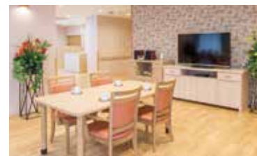
ダイニング内の団楽スペース