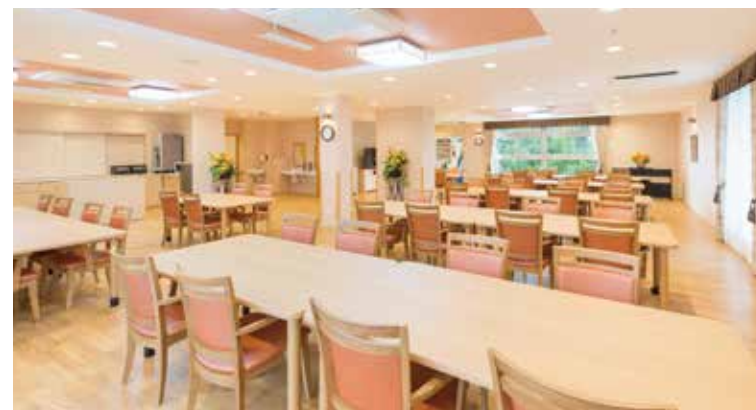
大きな窓から陽光が差し込む明るいダイニング

ゆったりとしたダイニング(食堂)や思い思いに過ごせるスペースをホーム各所に配置。日常的にゆとりと癒しを実感できる共用空間・設備をご用意しています。