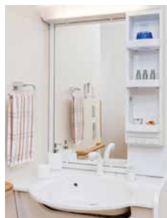
清潔感のある洗面化粧台を各居室に設置