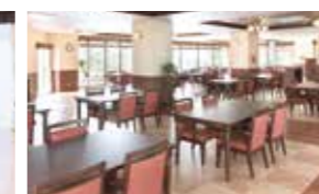
大きな窓に面し明るさいっぱいダイニング