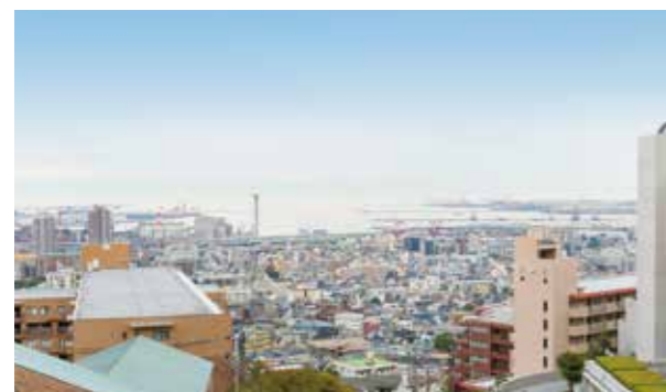
ホーム4階からの眺望(平成27年11月撮影)

窓越しに広がるのは、澄み渡る青空、豊かな緑、そして神戸市街地。丘の上ならではの優れた眺望をご堪能ください。ここは、地域に寄り添い、誰もが笑顔で気軽に立ち寄れるような安らぎの場所となります。山手の上質な雰囲気の中、ゆとりある穏やかな日々をお過ごしください。