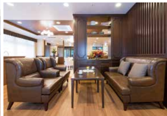
平成27年11月撮影／建物・賃借