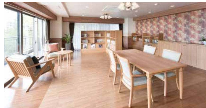
自由に読書を楽しめるラウンジ

ゆとりと癒しに満ちた共用空間・設備をご用意。広々としたダイニング(食堂)、知的な好奇心を満たす様々な本が揃ったラウンジ、ゆったりと過ごせるカフェなど充実しています。