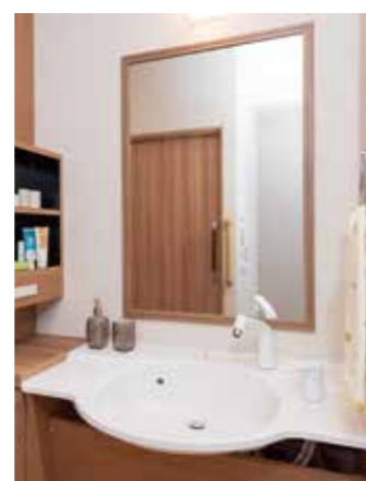
清潔感のある洗面化粧台を各居室に設置