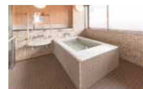
ゆったりとした気分で入れるお風呂