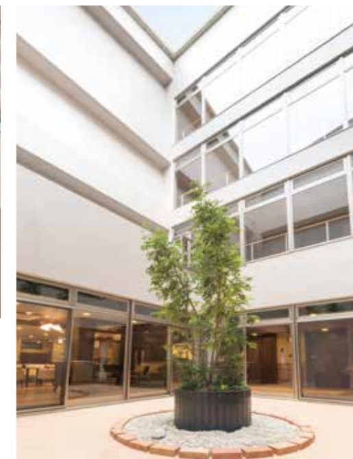
日射しが心地よい吹き抜けの中庭