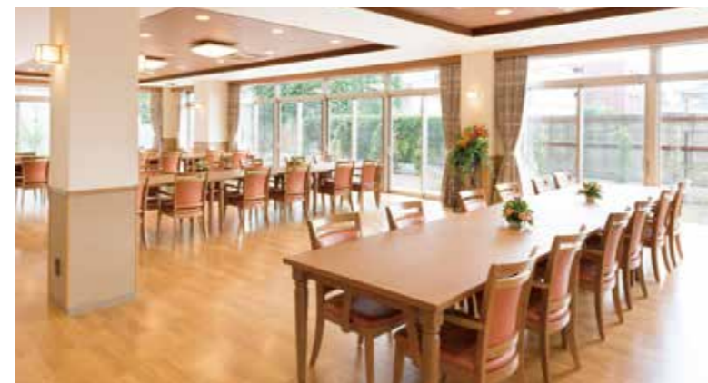
大きな窓から陽光が差し込む明るいダイニング

窓の大きなダイニング(食堂)やお散歩や日光浴をお楽しみいただける中庭をはじめ、日常的にゆとりと癒しを実感できる共用空間・設備をご用意しています。