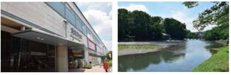
飯能駅南口 飯能河原

飯能は、西武池袋線で都心から約50分。多彩なお店が入った駅ビルをはじめ、生活利便施設が整った暮らしやすい街です。一方、遊歩道の散策が楽しめる飯能河原など、四季折々の自然と豊かな歴史をもつ森林文化都市でもあり、悠々自適の日々をお過ごしいただける理想的な環境です。