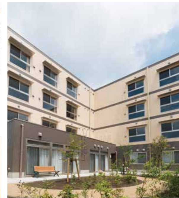
季節を美しく映す中庭