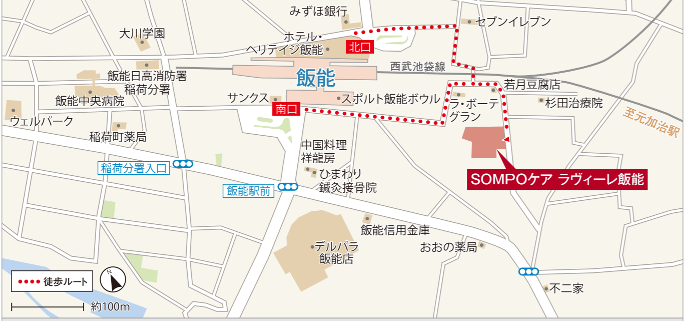
埼玉県飯能市南町2-7 ※掲載の情報は平成30年7月現在のものです。

■西武バス「美杉台ニュータウン」バス停よりバスでお越しの場合 「美杉台ニュータウン」バス停より、飯能駅南口 行きバス約6分 → 飯能駅南口 バス停下車徒歩5分(約400m)