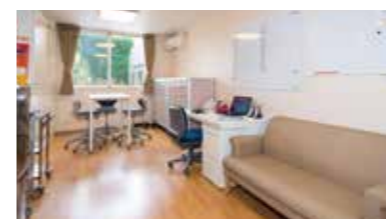
ご入居者さまの健康をサポートする健康管理室