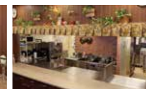
できたての美味しい料理を調理するオープンキッチン