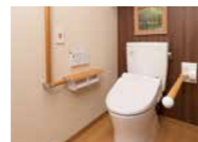
車椅子でも使いやすいトイレ

昨日より今日、今日より明日と、笑顔の数がひとつでも増えていくように。 お一人おひとりにとって本当にうれしい介護をカタチにしていまいます。