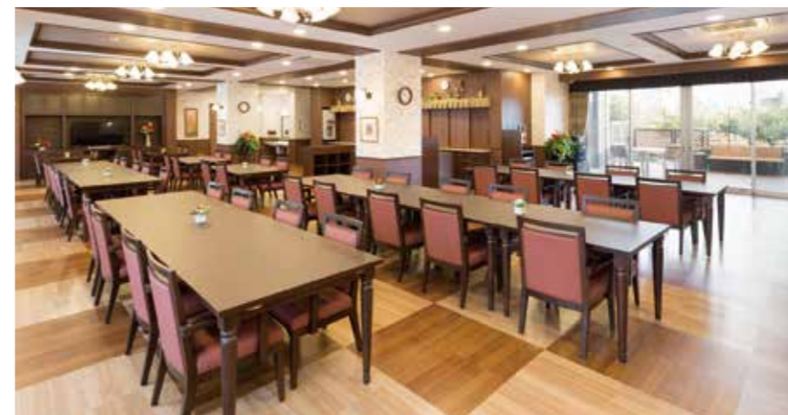
大きな窓から陽光が差し込む明るいダイニング

ゆったりとしたダイニング(食堂)や思い思いに過ごせるカフェなど、日常的にゆとりと癒しを実感できる共用空間・設備をご用意しています。