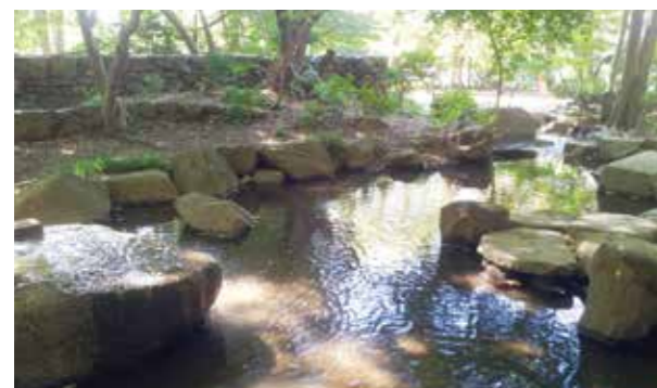
散歩コースとしてご利用いただける岡本公園

閑静な住宅街に佇むホーム。 すぐそばには、散歩にぴったりの「岡本公園」もあります。 公園のゆたかな緑に四季の移ろいを感じながら、 近隣の保育園や学校に通う子どもたちや 地域の方々とのふれあいを楽しみながら。 いつまでも笑顔の絶えない、健やかな日々を、 ここ二子玉川でお過ごしください。