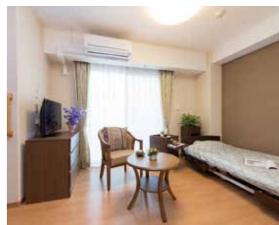
居室(横向き/モデルルーム)