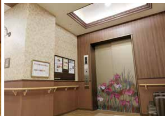
※内観写真は平成27年2月撮影/建物:賃借