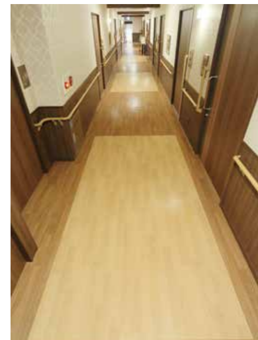
床面には3mおきに印があり、歩行リハビリの目安になります。