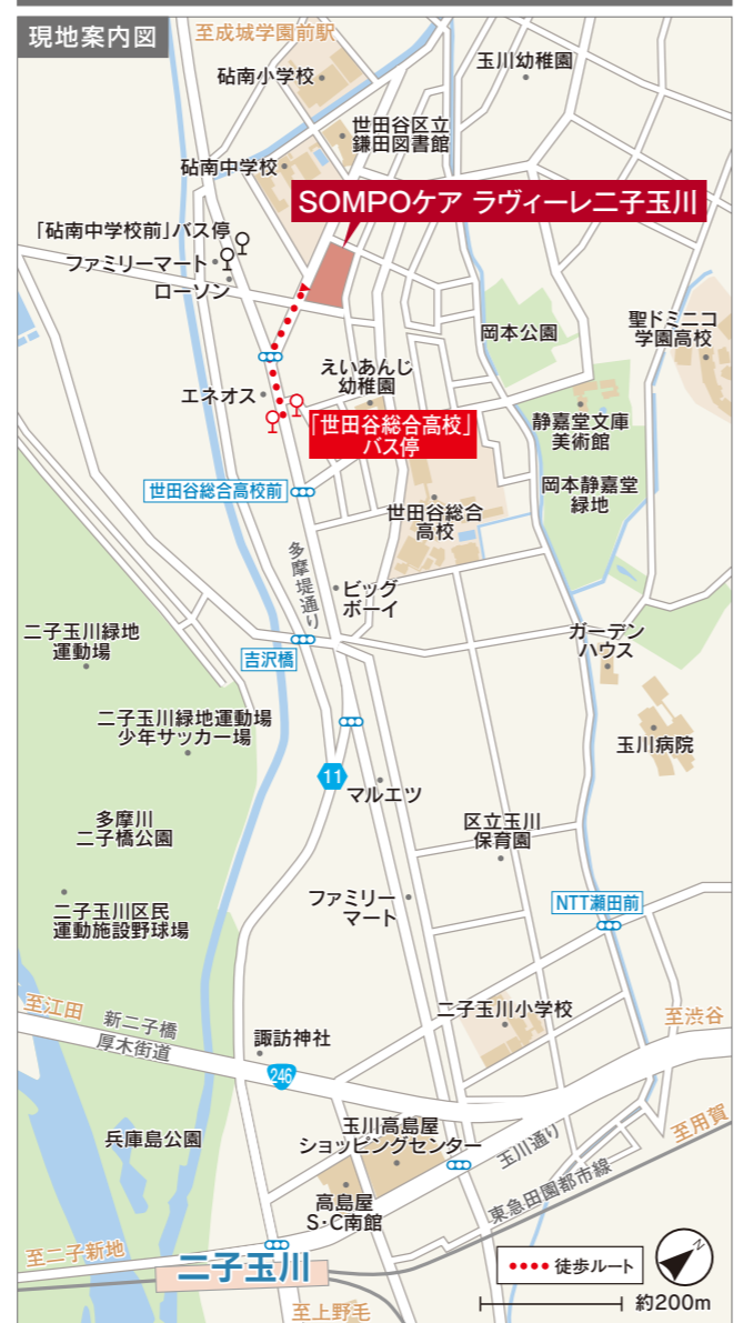
※掲載の情報は平成28年4月現在のものです。

■「SOMPOケア ラヴィーレニ子玉川」施設概要 ●所在地/〒157-0077 東京都世田谷区鎌田3-27-3 ●共用設備/ダイニング(食堂)兼機能訓練コーナー、カフェ、ラウンジ他 ●構造規模/鉄筋コンクリート造4階建(賃借:平成27年3月より25年間) ●土地・建物権利関係/事業主体非所有 ●類型/介護付有料老人ホーム(一般型特定施設入居者生活介護) ●権利形態/利用権方式 ※ご入居の状況によって同施設内で住み替える場合、利用権を消滅させ、新たに別の介護居室の利用権を設定します。 ●入居条件/介護保険制度における要支援・要介護認定を受けられた、原則65歳以上の方。前払金や月々の生活費を支弁できる方。 ●居室総数/54室(全室個室)18.00㎡~18.07㎡ ●建物完成年月/平成26年12月 ●開設年月日/平成27年3月1日 ●管理費の使途/事務費、管理部門に係る人件費等。 ●共用部家賃相当額の使途/共用部の水道光熱費、減価償却費、保守管理費等、建物の維持管理に係る費用等。 ●実費負担いただく項目(例)/おむつ、日用品、新聞・雑誌等購読、業者依頼クリーニング、理美容、個人的外出の付き添い費用及び交通費、買い物等代行(週1回までは介護保険に含まれます。)、受診時医療、クラブ・アクティビティ材料等。週3回目からの入浴介助等が別途個別負担になります。 ●介護保険給付対象外の有料サービスの一例/役所手続き代行など。 ●介護保険/東京都指定特定施設入居者生活介護・介護予防特定施設入居者生活介護 ●職員体制/2.5:1以上