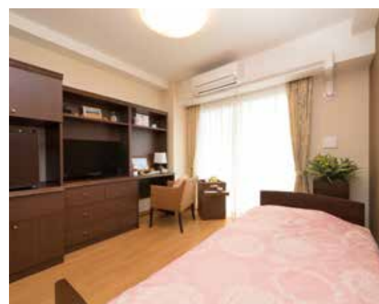
お気に入りの家具を持ち込める居室(縦向き/モデルルーム)

お好みの居室を選ぶことができ、ご自分らしい生活をお楽しみいただけます。 また、各室に緊急コールを設置し、安心・安全に配慮しています。