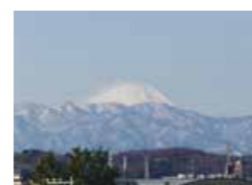
4階からの富士山の眺望