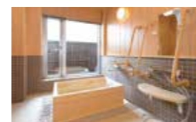
ゆったりとした気分で入れるヒノキ風呂