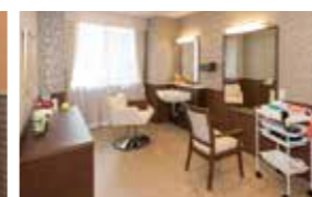
いつまでも美しくいていただくための理美容室