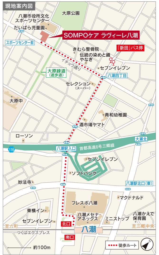
※掲載の情報は平成28年4月現在のものです。