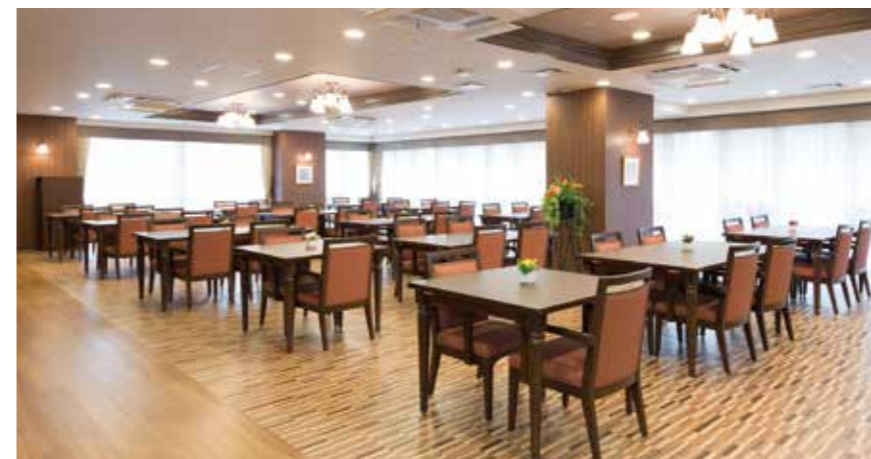
大きな窓から陽光が差し込む明るいダイニング

明るく広々としたダイニング、ゆったりくつろげるカフェなど、ご入居者さまが自然と集う居心地の良い空間をご用意しました。