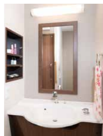
清潔感のある洗面化粧台を各居室に設置