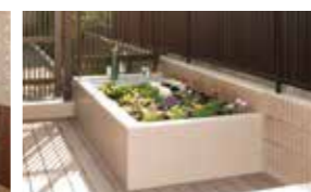
花や野菜を育てる農園