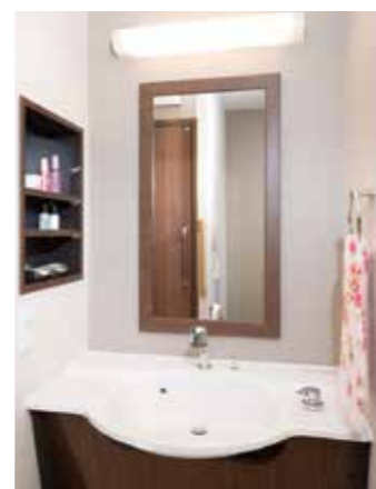
清潔感のある洗面化粧台を各居室に設置