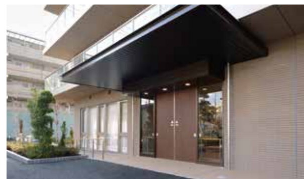
ここに住まう方々やご家族を優雅に出迎えるエントランス ※建物写真は平成27年1月撮影 / 建物: 賃借

桜並木や緑ゆたかな大原公園をすぐそばに佇むホーム。 認知症の方も安心の環境が整っており、 また、日常の中で気軽に行えるリハビリメニューも 数多くご用意しています。 いつまでもご自分らしく、健やかに。 ここ八潮で、笑顔に満ちた日々をお過ごしください。