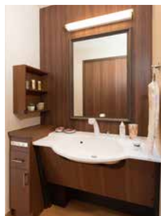
清潔感のある洗面化粧台を各居室に設置