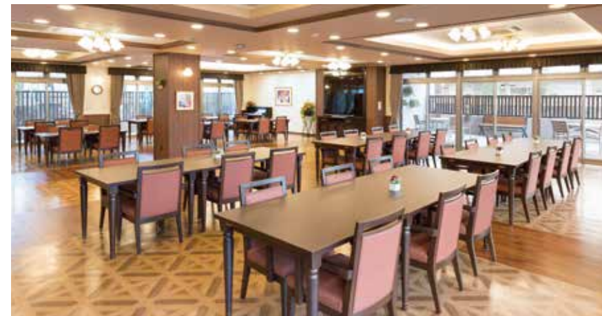
大きな窓から陽光が差し込む明るいダイニング

ゆったりとしたダイニング（食堂）や思い思いに過ごせるカフェなど、 日常的にゆとりと癒しを実感できる共用空間・設備をご用意しています。