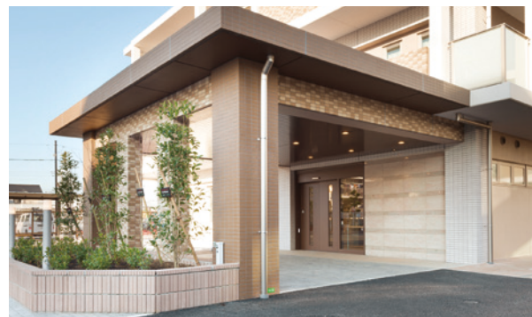
ここに住もう方々やご家族を優雅に出迎えるエントランス ※建物写真は平成26年12月撮影／建物：賃借

駅から徒歩6分と利便性に優れた 「SOMPOケア ラヴィーレ習志野台」。 医療と介護が密にコミュニケーションをとる医療連携。 また、ホームのスタッフすべてのチームケアによって、 毎日の安心をお守りします。 四季折々のイベントやレクリエーションも数多くご用意。 季節の移ろいを感じながら、 のびのびと憩う日々をお過ごしください。