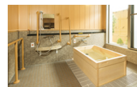
ゆったりとした気分で入れるヒノキ風呂