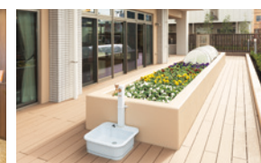
花や野菜を育てる農園

昨日より今日、今日より明日と、笑顔の数がひとつでも増えていくように。 お一人おひとりにとって本当にうれしい介護をカタチにしていまいます。