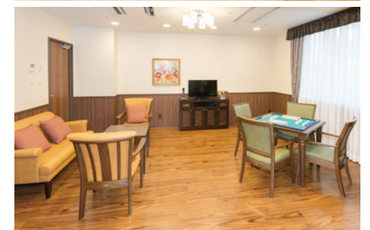
ご入居者さまの憩いの場となる多目的室