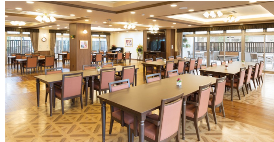
大きな窓から陽光が差し込む明るいダイニング

ゆったりとしたダイニング（食堂）や思い思いに過ごせるカフェなど、 日常的にゆとりと癒しを実感できる共用空間・設備をご用意しています。