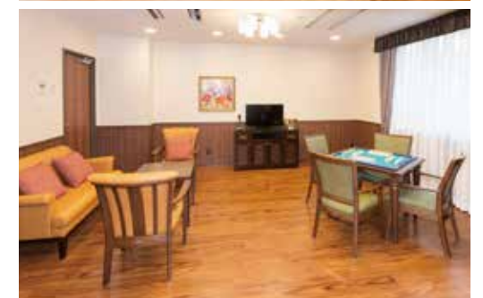
ご入居者さまの憩いの場となる多目的室