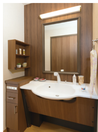
清潔感のある洗面化粧台を各居室に設置