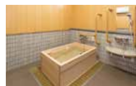
ゆったりとした気分で入れるヒノキ風呂