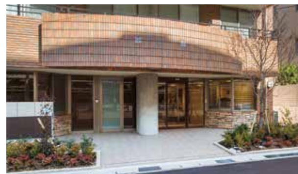
ここに住まう方々やご家族を優雅に出迎えるエントランス ※建物写真は平成26年12月撮影/建物:賃借

「SOMPOケア ラヴィーレ西宮」では、 楽しみながら介護予防ができるよう、 日々のアクティビティやレクリエーションを数多くご用意。 ホームのすぐそばには、 四季の変化を感じていただける春風公園があり、 気軽に散歩もお楽しみいただけます。 いつまでも健やかな笑顔あふれる日々を、 ここ西宮でお過ごしください。