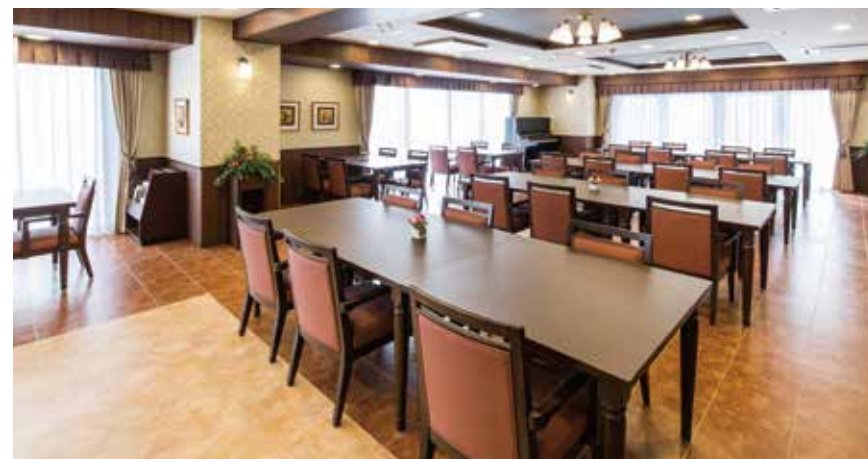
大きな窓から陽光が差し込む明るいダイニング

ゆったりとしたダイニング(食堂)や思い思いに過ごせるカフェなど、日常的にゆとりと癒しを実感できる共用空間・設備をご用意しています。