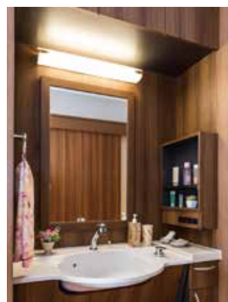
清潔感のある洗面化粧台を各居室に設置