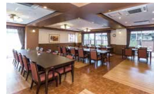
大きな窓から陽光が差し込む明るいダイニング