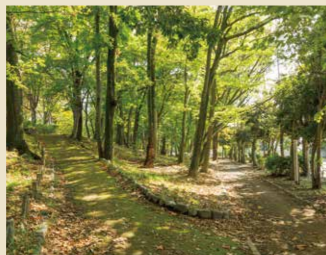
木陰に優しく包まれた「水木公園」