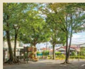
子供達の遊び場となる「こんぴら山児童公園」