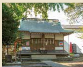
厳かな時が流れる「五ノ神社」

ホームの周辺には武蔵野の面影が息づく「水木公園」や 601年に創建され、現在の地名に受け継がれた「五ノ神社」 などいくつかの散歩スポットが点在しています。 また足を伸ばせば多摩川も。 四季折々の表情で楽しませてくれます。