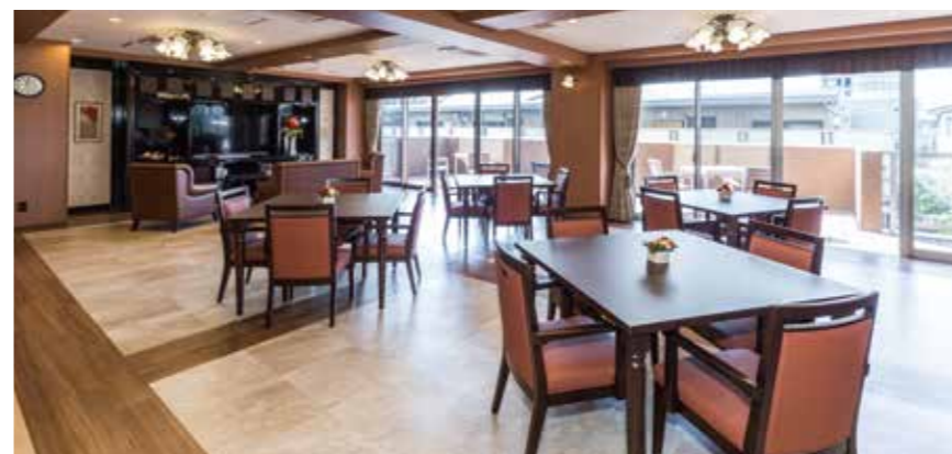
ご入居者さまに心地よくお過ごしいただける共用スペース

ゆったりとしたダイニング(食堂)や思い思いに過ごせるカフェなど、 日常的にゆとりと癒しを実感できる共用空間・設備をご用意しています。