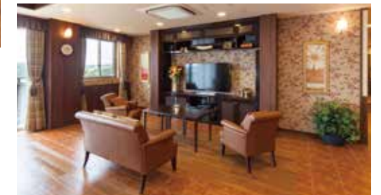
思い思いにお過ごしいただけるラウンジ