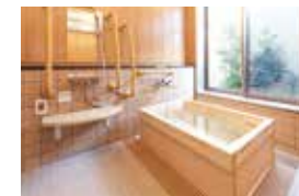
ゆったりとした気分で入れるヒノキ風呂