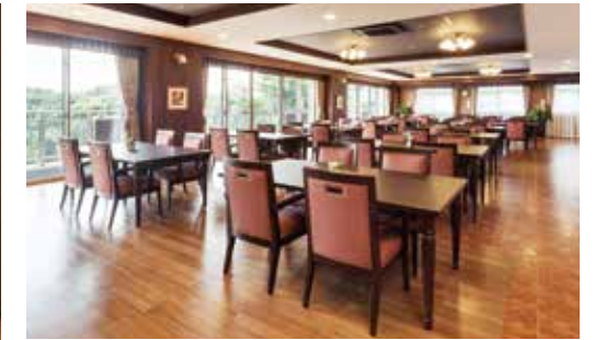
大きな窓から陽光が差し込む明るいダイニング