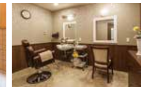
いつまでも美しくいていただくための 理美容室