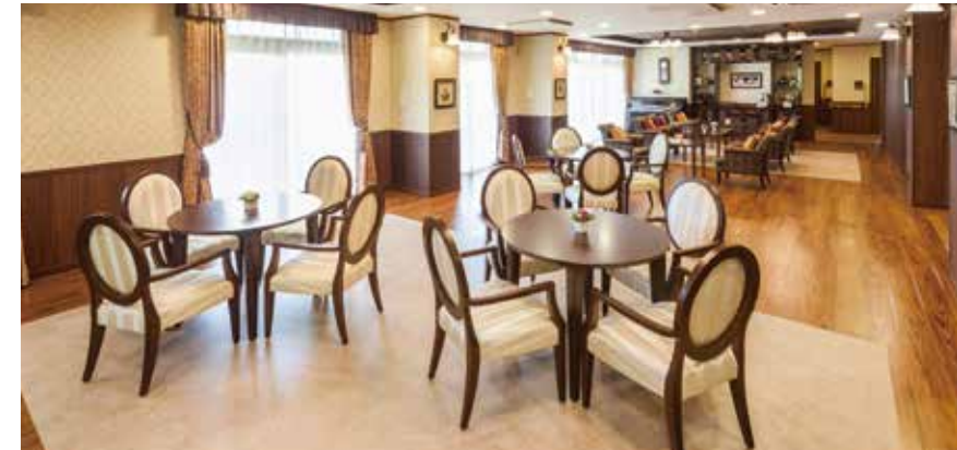
落ち着いた雰囲気心地よいカフェ

ゆったりとしたダイニング(食堂)や思い思いに過ごせるカフェなど、 日常的にゆとりと癒しを実感できる共用空間・設備をご用意しています。