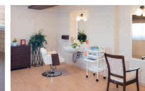
いつまでも美しくいていただくための理美容室