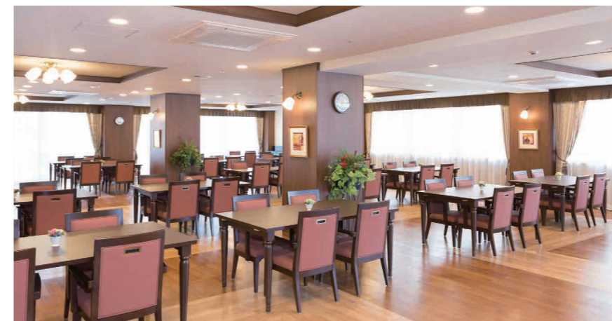
大きな窓から陽光が差し込む明るいダイニング

ゆったりとしたダイニング（食堂）や思い思いに過ごせるカフェなど、日常的にゆとりと癒しを実感できる共用空間・設備をご用意しています。