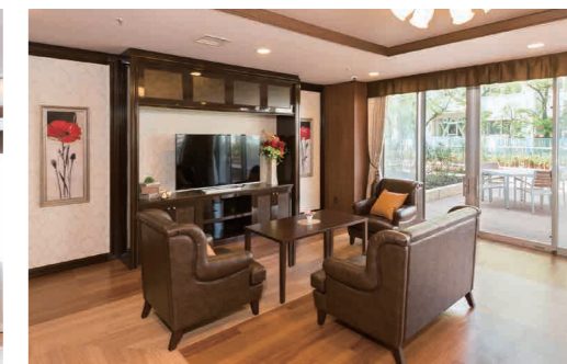
ご入居者さまに心地よくお過ごしいただける共用スペース