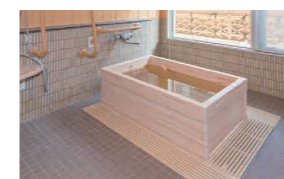
ゆったりとした気分で入れるヒノキ風呂