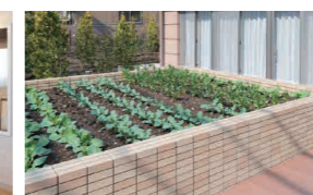
花や野菜を育てる農園