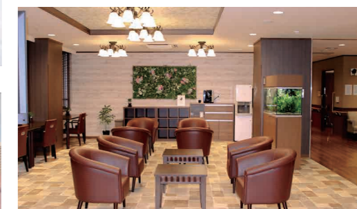
エントランス横のカフェスペース

昨日より今日、今日より明日と、笑顔の数がひとつでも増えていくように。 お一人おひとりにとって本当にうれしい介護をカタチにしていまいます。