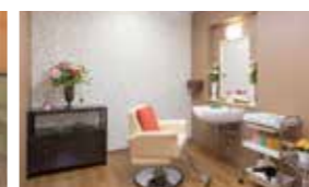
いつでも美しくいていただくための理美容室