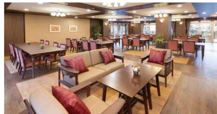
ご入居者さま同士でのご歓談を楽しんでいただけるダイニングなど、心地よく過ごしていただける共用スペース

ゆったりとしたダイニング(食堂)や思い思いに過ごせるカフェなど、日常的にゆとりと癒しを実感できる共用空間・設備をご用意しています。