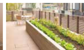
花や野菜を育てる農園