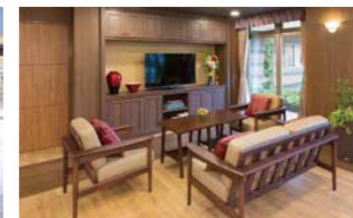
ダイニングの一角にある、くつろぎのスペース