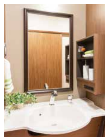
清潔感のある洗面化粧台を各居室に設置