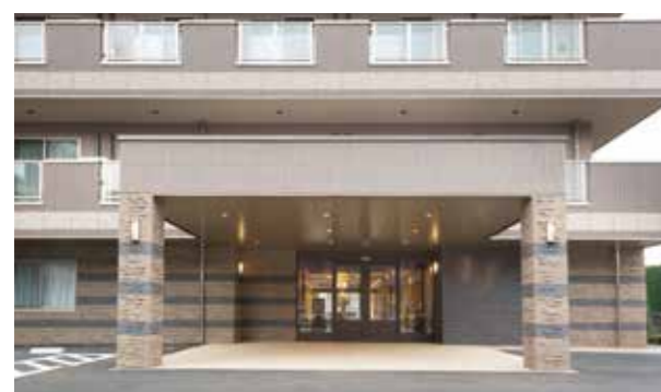
ここに住まう方々やご家族を優雅に出迎えるエントランス ※建物写真は平成25年11月撮影/建物:賃借

東武東上線「鶴ヶ島」駅近くの閑静な住宅地に佇む「SOMPOケア ラヴィーレ鶴ヶ島」。 関越自動車道・圏央道からのアクセスもスムーズです。 ホームには、陽の光あふれる大きなダイニングやウッドデッキテラスがあり、 いつでも、ゆっくりとお茶や談笑をお楽しみいただけます。 ここ鶴ヶ島で、心地良いくつろぎの日々をお過ごしください。