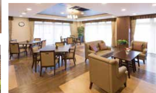
思い思いにお過ごしいただけるラウンジ