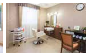
いつまでも美しくいていただくための 理美容室