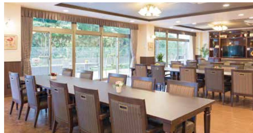
大きな窓に面し明るさいっぱいのダイニング(食堂)

ゆったりとしたダイニング(食堂)や思い思いに過ごせるカフェなど、日常的にゆとりと癒しを実感できる共用空間・設備をご用意しています。