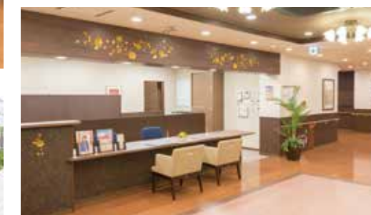
優雅で落ち着いた雰囲気のエントランスロビー

ご家族と、お友達と、語らい愉しむ団欒のホーム。 心おだやかな、笑顔に満ちた暮らしを。