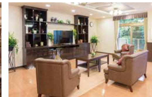
ご入居者さまの憩いの場となるラウンジ