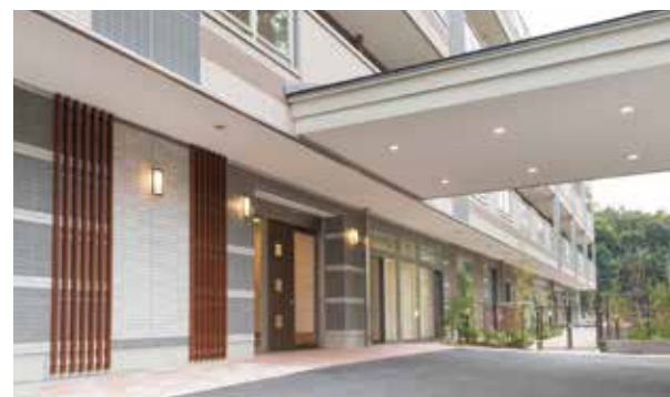
ここに住まう方々やご家族を優雅に出迎えるエントランス ※建物写真は平成25年10月撮影/建物:賃借

ご家族と、お友達と、語らい愉しむ団欒のホーム。 心おだやかな、笑顔に満ちた暮らしを。