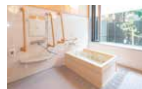
ゆったりとした気分に入れる ヒノキ風呂