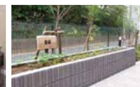
花や野菜を育てる農園