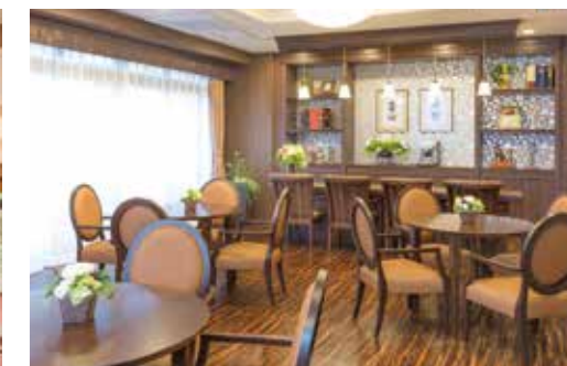
思い思いにお過ごしいただけるカフェ