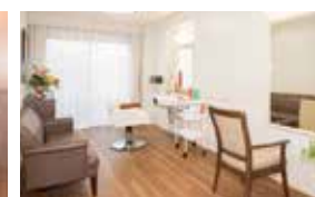
いつまでも美しくいただくための 理美容室