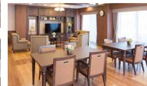
ご入居者さまの憩いの場となるラウンジ