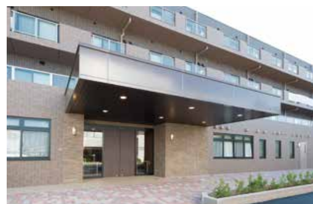
ここに住まう方々やご家族を優雅に出迎えるエントランス ※建物写真は平成25年10月撮影 / 建物:賃借

JR中央線「武蔵境」駅と西武多摩川線「武蔵境」駅が利用でき、小田急バス「武蔵境営業所」からも徒歩2分の近さ。そんな利便性に優れた立地が魅力の「SOMPOケア ラヴィーレ武蔵境」。開放感いっぱいのウッドバルコニーや、四季を感じられる果樹園と銀杏畑。武蔵境だからこそ叶う、自然の安らぎに満ちた暮らしをお楽しみください。