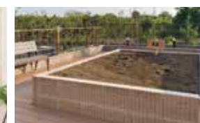
花や野菜を育てる農園