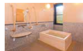
ゆったりとした気分に入れる ヒノキ風呂