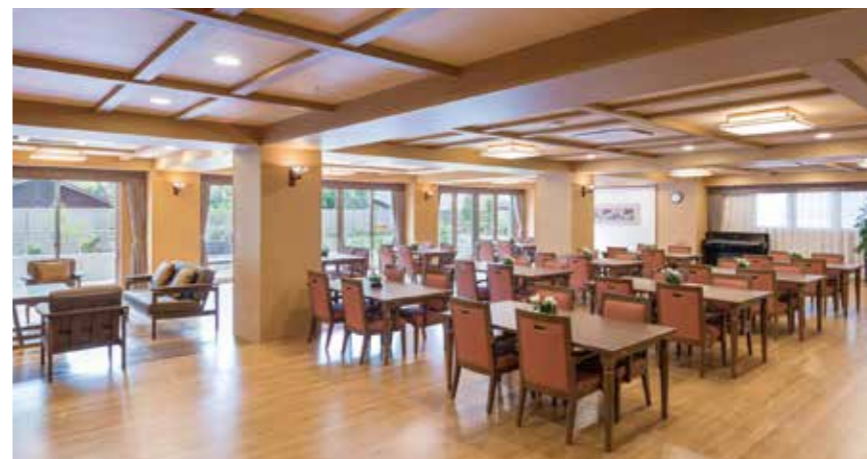
大きな窓から陽光が差し込む明るいダイニングなど、ご入居者さまに心地よく過ごしていただける共用スペース

ゆったりとしたダイニング(食堂)や思い思いに過ごせるカフェなど、日常的にゆとりと癒しを実感できる共用空間・設備をご用意しています。