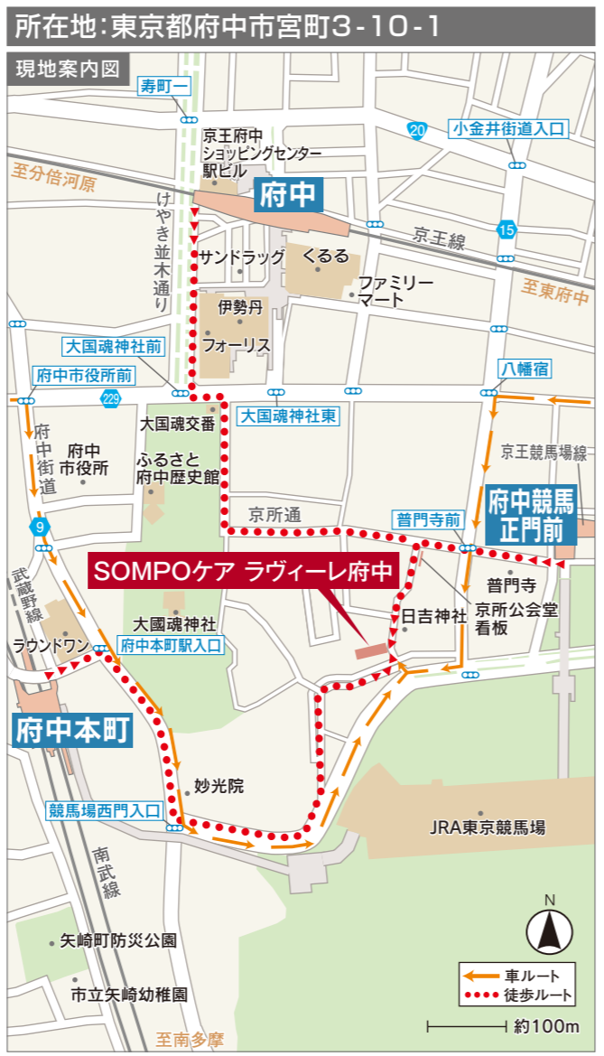
※掲載の情報は平成28年4月現在のものです。

■旧甲州街道を「国立方面」からお越しの場合 府中市役所前を右折、府中街道へ→約600m先「競馬場西門入口」を左折→約500m先を左折し、左側がホーム