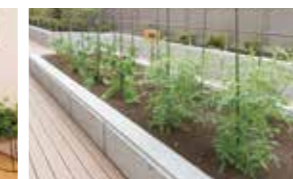
花や野菜を育てる農園

四季を彩る、社寺の緑にけやき並木。 府中の豊かな自然をそばに憩う、やすらぎの毎日を。