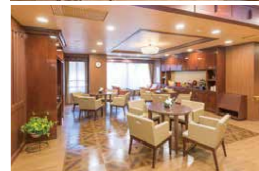
アットホームな雰囲気の中でお茶や、友人との会話を楽めるカフェ