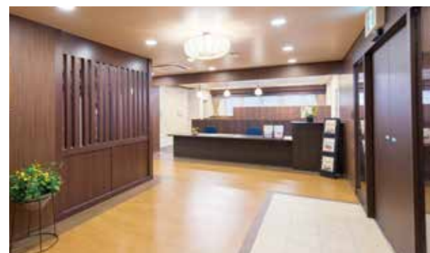
ここに住まう方々やご家族を優雅に出迎えるエントランスロビー ※建物写真は平成25年8月撮影/建物:賃借

四季を彩る、社寺の緑にけやき並木。 府中の豊かな自然をそばに憩う、やすらぎの毎日を。