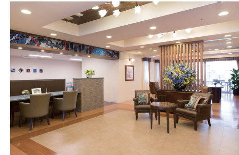
優雅で落ち着いた雰囲気のエントランスホール