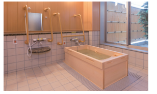
ゆったりとした気分で入れるヒノキ風呂