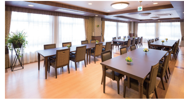
美味しく食事をお楽しみいただけるダイニング

ゆったりとしたダイニング(食堂)や開放感のあるヒノキ風呂など、 日常的にゆとりと癒しを実感できる共用空間・設備をご用意しています。