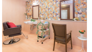
いつまでも美しくいていただくための理美容室