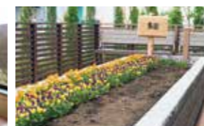
広々とした庭の一角 日当たりの良い場所に設けた農園