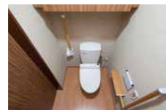
通常のトイレ(3・4階)