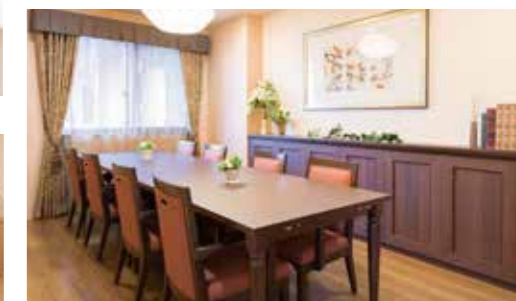
訪問された方と和やかなひとときを過ごせるファミリーダイニング