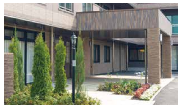
ここに住まう方々やご家族を優雅に出迎えるエントランス ※建物写真は平成25年4月撮影 / 建物: 賃借