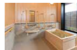
ゆったりとした気分に入れるヒノキ風呂