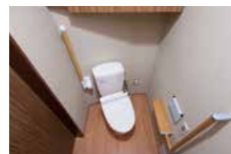
斜めに配置されたトイレ(2階)

2階居室のトイレは斜めに配置されています。これにより、少ない歩数で便座への方向転換が可能となり、転倒などのリスクを軽減することができます。