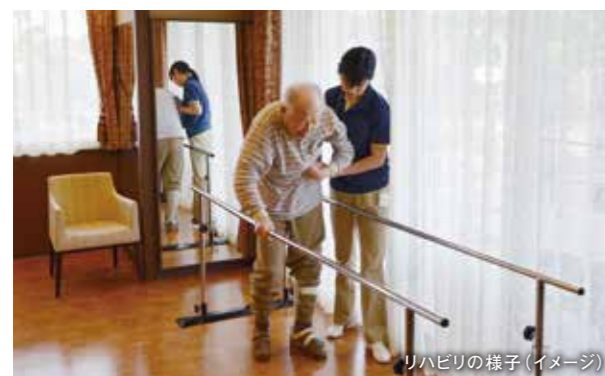
リハビリの様子(イメージ)

普段の暮らしが、自然とリハビリになっていく。 心身ともに、いつまでも健やかな日々を。