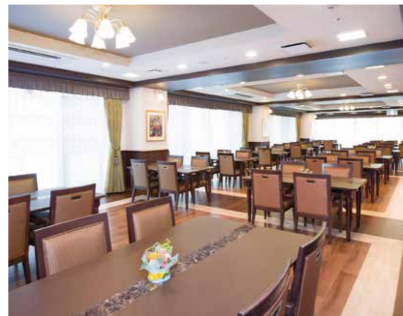
陽光が差し込む明るいダイニング

ゆったりとしたダイニング(食堂)や思い思いに過ごせるラウンジなど、日常的にゆとりと癒しを実感できる共用空間・設備をご用意しています。