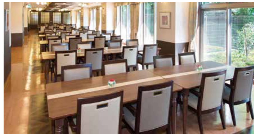
陽光の差し込む明るさいっぱいのダイニングをはじめご入居者さまに心地よく過ごしいただける共用スペース

ゆったりとしたダイニング(食堂)や思い思いに過ごせるカフェなど、日常的にゆとりと癒しを実感できる共用空間・設備をご用意しています。