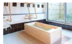
ゆったりとした気分で入れるヒノキ風呂