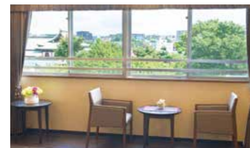
社寺の緑を眺めながら、ご入居者さま同士お話できるラウンジ