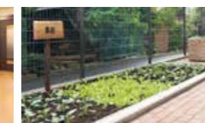
花や野菜を育てる農園