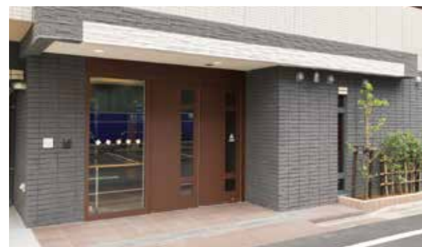
ここに住まう方々やご家族を優雅に出迎えるエントランス ※建物写真は平成24年8月撮影/建物:賃借

電車でも、車でも、アクセス抜群な練馬のホーム。 利便性と豊かな自然に恵まれた、快適な暮らしがはじまります。