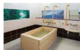
ゆったりとした気分で入れるヒノキ風呂