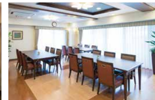
大きな窓から陽光が差し込む明るいダイニング