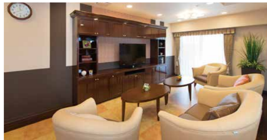
ご入居者さまに心地よく過ごしいただける共用スペース

ゆったりとしたダイニング(食堂)や思い思いに過ごせるカフェなど、日常的にゆとりと癒しを実感できる共用空間・設備をご用意しています。