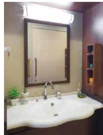
清潔感のある洗面化粧台を各室に設置