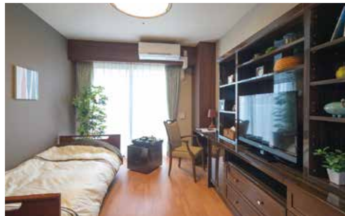
お気に入りの家具を持ち込める居室（モデルルーム）

安心してお過ごしいただけるよう、緊急コールを各室とトイレに設置し、 車椅子のご利用にも配慮しています。