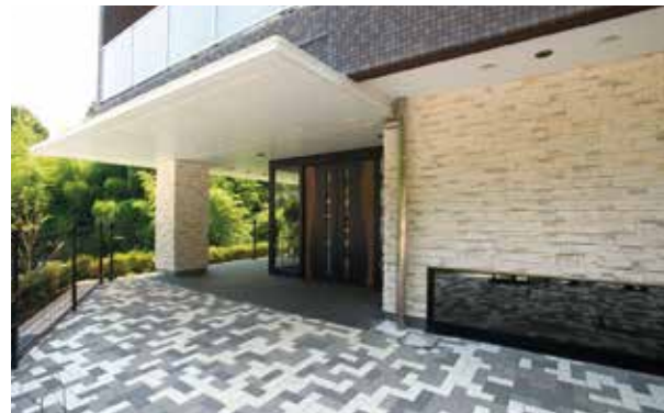
ここに住まう方々やご家族を優雅に出迎えるエントランス ※建物写真は平成24年7月撮影／建物：賃借

閑静な住宅街、王禅寺。 その丘陵に静かに佇む「SOMPOケア ラヴィーレ王禅寺」。 「新百合ヶ丘」駅や「たまプラーザ」駅など、4駅が利用可能です。 ホームのすぐそばには、 昔から人々の暮らしと共にあった里山の風景。 その雄大な自然を、 どこにいても身近に感じながらお寛ぎいただけます。 自然の温もりをいつもそばに、心地よい日々をお過ごしください。