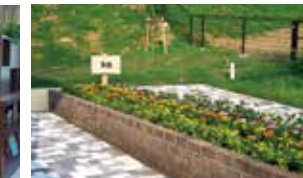
花や野菜を育てる農園