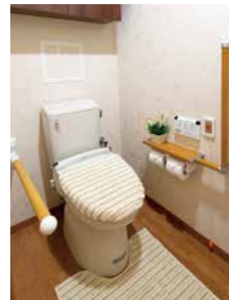
車椅子でも使いやすいトイレ