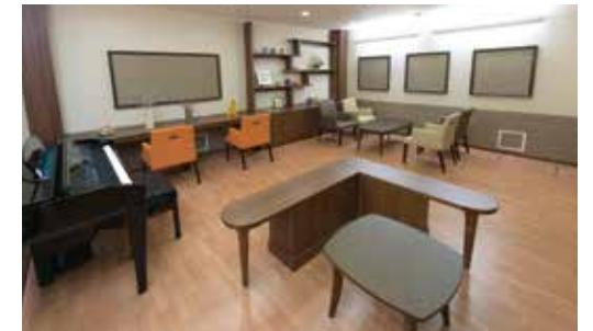
様々なイベントやアクティビティの会場にもなる多目的室

昨日より今日、今日より明日と、笑顔の数がひとつでも増えていくように。 お一人おひとりにとって本当にうれしい介護をカタチにしていまいます。