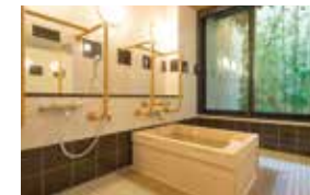
ゆったりとした気分で入れるヒノキ風呂