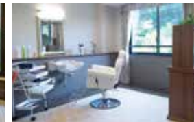
いつまでも美しくいていただくための 理美容室