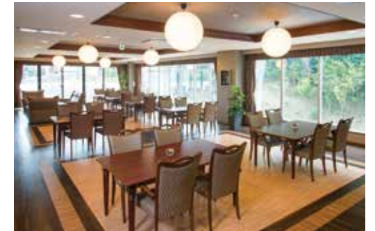
窓の外に広がる豊かな緑も楽しめるダイニング