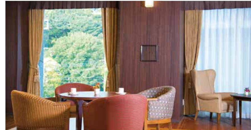
落ち着いた雰囲気のカフェをはじめご入居者さまに心地よくお過ごしいただける共用スペース

明るく開放的なダイニング（食堂）や思い思いに過ごせるカフェなど、 日常的にゆとりと癒しを実感できる共用空間・設備をご用意しています。