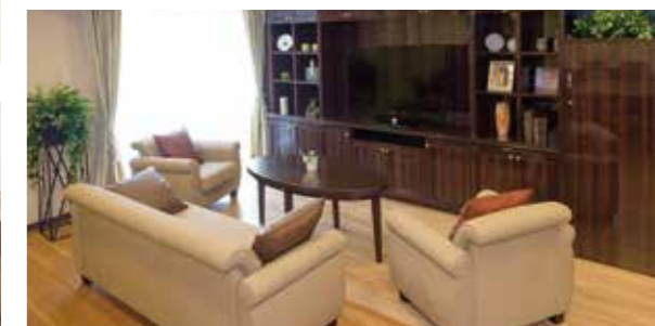
ご入居者さまの憩いの場となる共用空間

都心からのアクセスが至便なホーム。 自然に溢れた穏やかな日々を、お楽しみください。