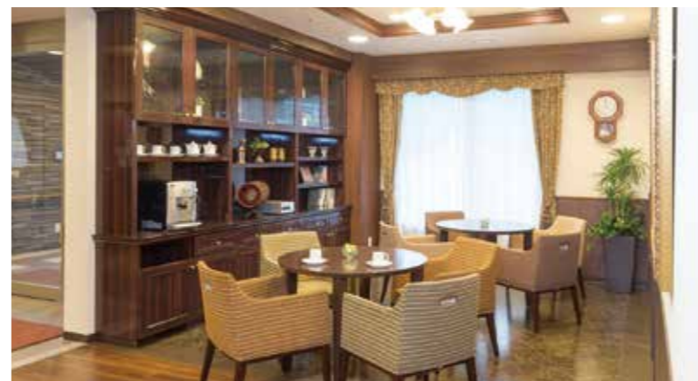
思い思いにお過ごしいただけるカフェ

各階に設けたダイニング(食堂)や思い思いに過ごせるカフェなど、日常的にゆとりと癒しを実感できる共用空間・設備をご用意しています。