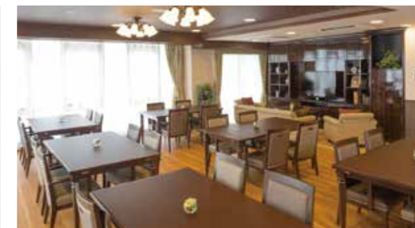
窓の外に広がる豊かな緑も楽しめるダイニング