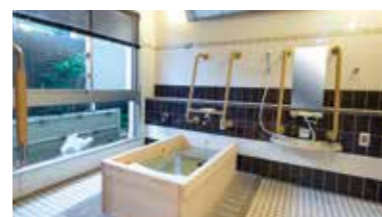
窓の外に緑が見え、ゆったりとした気分に入れるヒノキ風呂