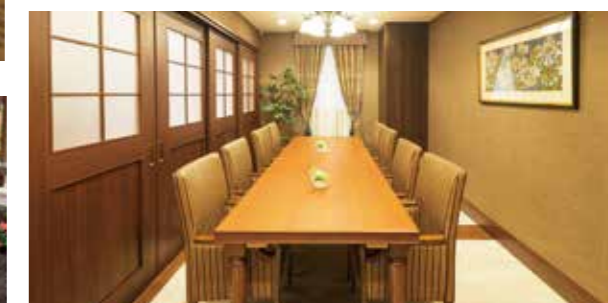
訪問されたご家族と和やかなひとときを過ごせるファミリーダイニング

横須賀の空と街を一望できる、大きな屋上テラス。 爽やかな潮風に包まれた、開放感に満ちた暮らしを。