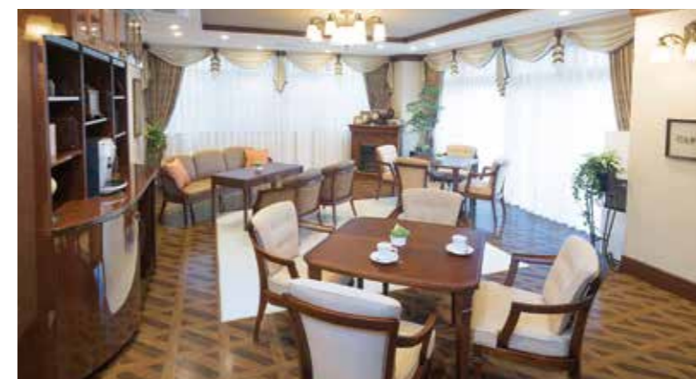
落ち着いたカフェをはじめご入居者さまに心地よく過ごしいただける共用スペース

ゆったりとしたダイニング(食堂)や思い思いに過ごせるカフェなど、日常的にゆとりと癒しを実感できる共用空間・設備をご用意しています。