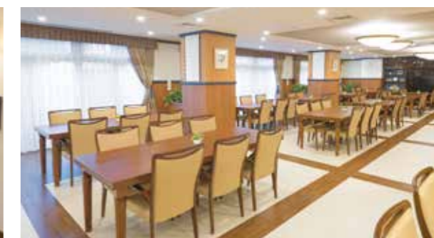
大きな窓から陽光が差し込む、明るさいっぱいのダイニング