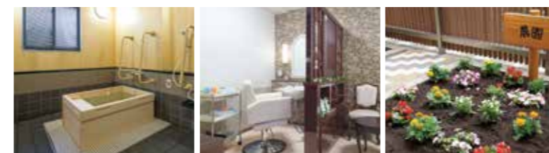
ゆったりとした気分に入れるヒノキ風呂 いつでも美しくいただくための理美容室 花や野菜を育てる農園