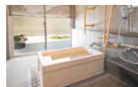
ゆったりとした気分で入れるヒノキ風呂