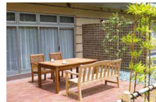
陽光やそよ風が気持ちよいテラス