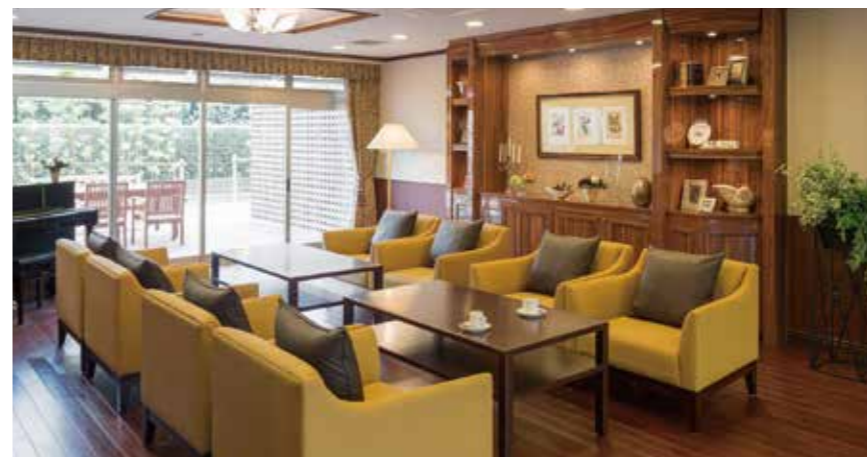
自由にご利用いただけるカフェをはじめご入居者さまに心地よくお過ごしいただける共用スペース

ゆったりとしたダイニング(食堂)や思い思いに過ごせるカフェなど、日常的にゆとりと癒しを実感できる共用空間・設備をご用意しています。