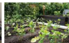
花や野菜を育てる農園

開放感あふれるウッドデッキテラスで四季を楽しむ。緑の癒しに包まれた、心地良い毎日ははじまります。