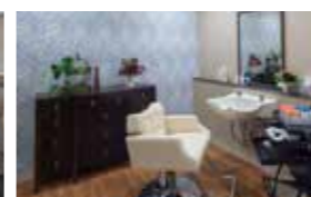
いつまでも美しくいていただくための理美容室