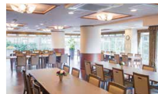
窓の外に広がる豊かな緑も楽しめるダイニング