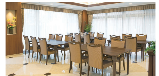
大きな窓に面し明るさいっぱいのダイニング

昨日より今日、今日より明日と、笑顔の数がひとつでも増えていくように。 お一人おひとりにとって本当にうれしい介護をカタチにしていまいます。