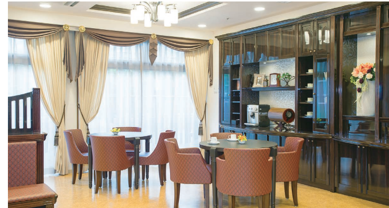
落ち着いたカフェをはじめご入居者さまに心地よくお過ごしいただける共用スペース

ゆったりとしたダイニング（食堂）や思い思いに過ごせるカフェなど、 日常的にゆとりと癒しを実感できる共用空間・設備をご用意しています。