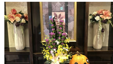
毎月変わる季節の生花