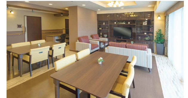
ご入居者さまの憩いの場となるラウンジ