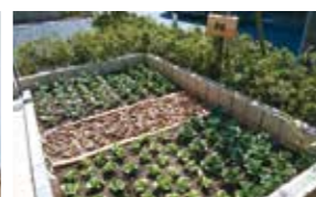
花や野菜を育てる農園

前原公園を目前に、緑いっぱいの景観を愉しむ。 開放感あふれる穏やかな暮らしが、ここにはあります。