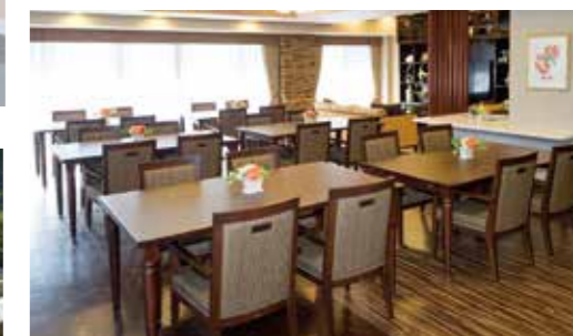
大きな窓に面し明るさいっぱいのダイニング