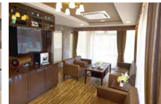
思い思いにお過ごしいただけるカフェ