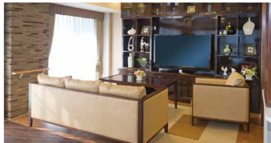
落ち着いたラウンジをはじめご入居者さまに心地よく過ごしていただける共用スペース

各階に設けたダイニング(食堂)や思い思いに過ごせるカフェなど、日常的にゆとりと癒しを実感できる共用空間・設備をご用意しています。