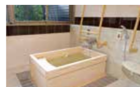
ゆったりとした気分で入れるヒノキ風呂