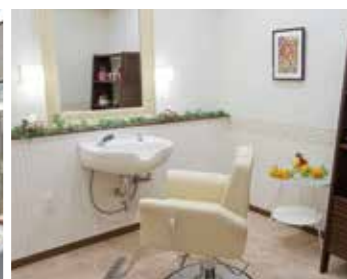
いつまでも美しくいていただくための理美容室