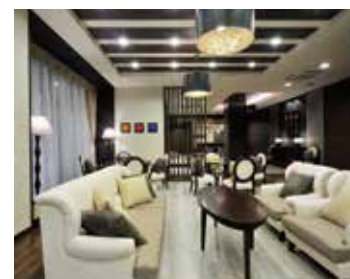
お好きな時間にご自由にくつろげるカフェ

本川を臨める開放感いっぱいの屋上と2階のバルコニー、農園、ヒノキ風呂など日常的にゆとりと癒しを実感できる共用空間・設備をご用意しています。