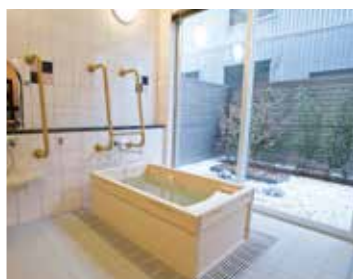
ゆったりとした気分に入れるヒノキ風呂