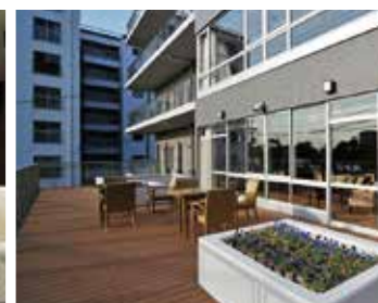
開放感あふれるバルコニーと農園