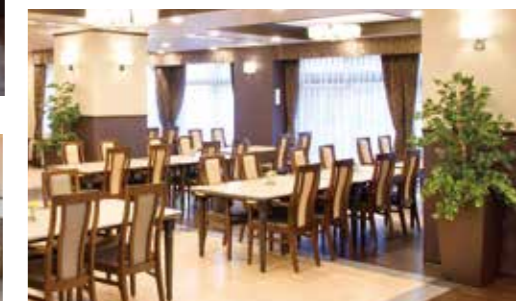
大きな窓に面し明るさいっぱいのダイニング(食堂)

交通の便利さと緑豊かな住環境が魅力のホーム。 広々とした住空間で、安らぎに満ちた毎日をお愉しみください。