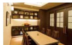
訪問されたご家族と和やかなひとときを過ごせるファミリダイニング