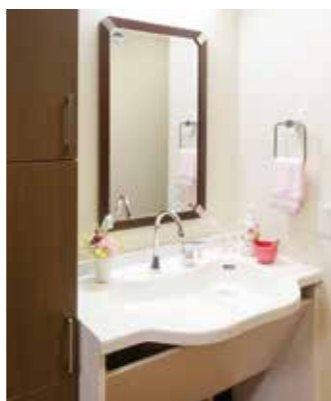
清潔感のある洗面化粧台を各室に設置