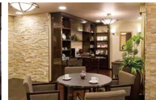
思い思いにお過ごしいただけるカフェ