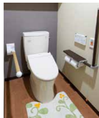
車椅子でも使いやすいトイレ

昨日より今日、今日より明日と、笑顔の数がひとつでも増えていくように。 お一人おひとりにとって本当にうれしい介護をカタチにしていまいます。